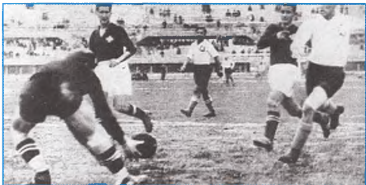
Чехословакия—Швейцария учрашувидан лавҳа.

ди. Чунончи, чемпионатни ўтказишга даъвогарлик қилган Швеция ўз талабномасини олдинроқ қайтариб олганди.