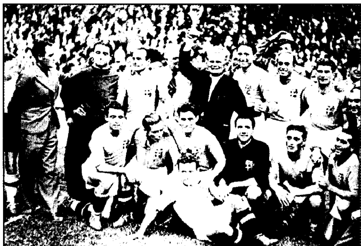
Жаҳон чемпиони — Италия терма жамоаси.

Голлар: Колаусси (6,35), Титкош (8), Пиола (19,82), Шароши (70).