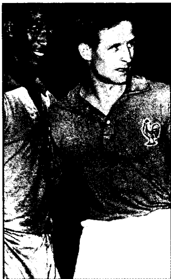
Чемпионатнинг энг кучли ўйинчиларидан Диди (Бразилия) ва Раймон Копа (Франция).

терма жамоа таркибига сингиб кетмайди, дегувчилар ҳам кўп эди.