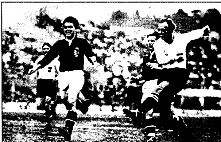
Жуда кескин ўтган Австрия — Венгрия ўйинидан лавҳа.

катта қизиқиш билан кузатдилар. Чунки 30-йилларнинг бошларидан жуда кучли ўйнай бошлаган Австрия терма жамоасини “Вундертим” (мўъжизакор жамоа) деб атардилар. Ҳақиқатан ҳам уларнинг таркибида Сеста, Бизан, Синделар, Смистик каби улкан футбол юлдузлари бор эди. Жамоа йўлбошчиси марказий ҳужумчи Синделарни эса ажойиб маҳорати туфайли “Футбол Моцарти” номи билан атардилар. Бироқ кескин ва муросасиз ўтган учрашувда Италия футболчилари 1:0 ҳисобида ғалаба қозондилар.