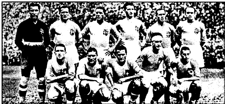
Жаҳон чемпиони — Италия терма жамоаси.

Чемпионатда 5 тадан тўп киритган Скиавио (Италия), Неедли (Чехословакия) ва Конен (Германия)лар энг сермахсул ҳужумчи шарафига муяссар бўлдилар.