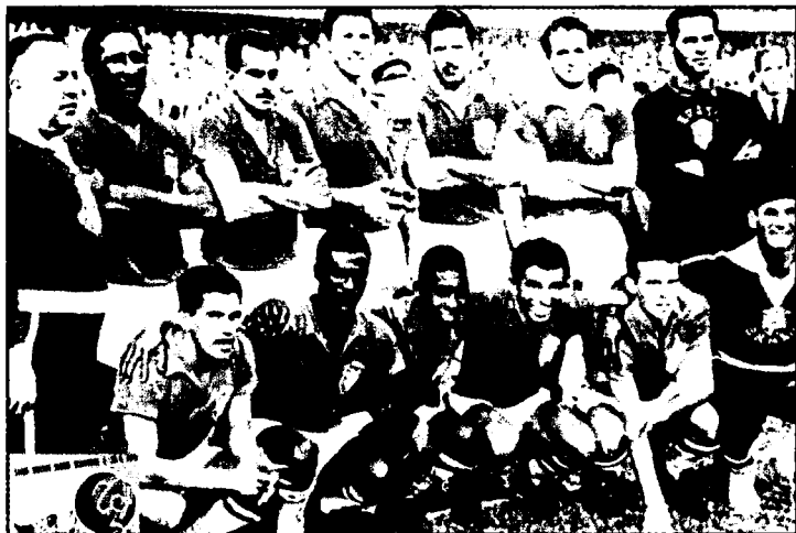
Жаҳон чемпиони — Бразилия терма жамоаси.

VI жаҳон чемпионати Хамрин, Зеелер, Фонтэн, Пьянтони, Копа, Тихи, Скоглунд, Пеле, Гарринча, Вава, Лидхольм каби жуда кўп футбол юдузларини кашф этди. Ўйинларда кўплаб тўплар киритилди. Чунончи, 13 тўп билан чемпионатда юқори натижа кўрсатган француз Ж. Фонтэннинг бу рекорди ҳали ҳам забт