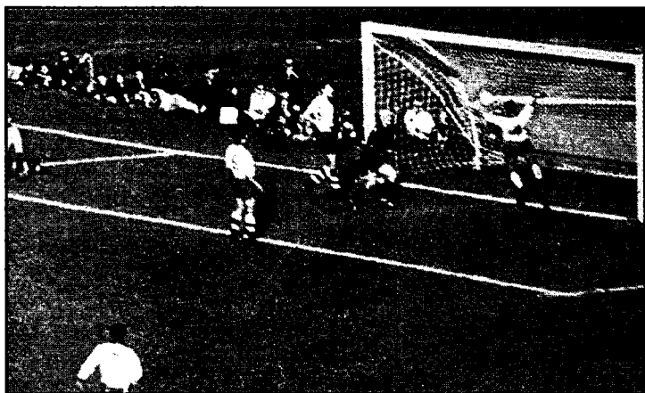
Зитонинг ушбу голидан сўнг бразилияликлар финалда 2:1 ҳисобида олдинга чиқиб олишди.

ринчанинг имкониятларидан имкон борича кўпроқ фойдаланиш мақсадида бир Бразилия журналисти кичик муғомбирликка қўл уриб, Англия термасига нисбатан мазкур футбол юлдузининг шахсиятини кўзғатди. Натижада, ушбу қизиқарли беллашувда Бразилия 3:1 ҳисобида ғалаба қозонди, бири-биридан чиройли бўлган икки тўпни эса Гарринча киритди. Мутахассисларнинг фикрича, бу Гарринчанинг спорт ҳаётидаги энг яхши беллашуви эди.