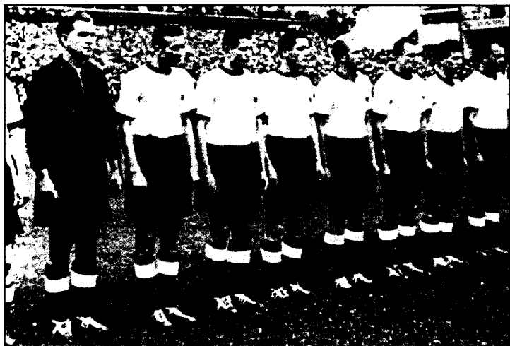
Жаҳон чемпиони — Германия терма жамоаси.

тилган биринчилик ҳисобланади, яъни 26 ўйинда тўп 140 маротаба дарвоза тўрига туширилган. Ўртача кўрсаткич бир ўйинда 5,38 гол.