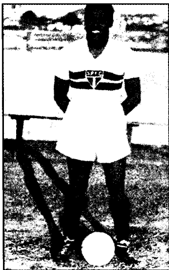
Чемпионатнинг энг абжир тўпураи — бразилиялик “Қора ёқут” Леонидас.

Бразилия терма жамоаси эса ўзининг юксак техникага асосланган енгил ўйини билан футбол ишқибозларини лол этди. Жамоанинг “юраги” “Қора ёқут” лақабини олган ҳужумчи Леонидас эди. Польша билан ўтказилган дастлабки ўйиндаёқ 3 тўп киритган (қўшимча вақтда майдонга ялангоёқ ҳолда тушиб, ҳатто 2 тўп ҳам урган!) Леонидас жаҳон футболининг янги юлдузи сифатида тан олинди. Умуман, ушбу учрашув чемпи-