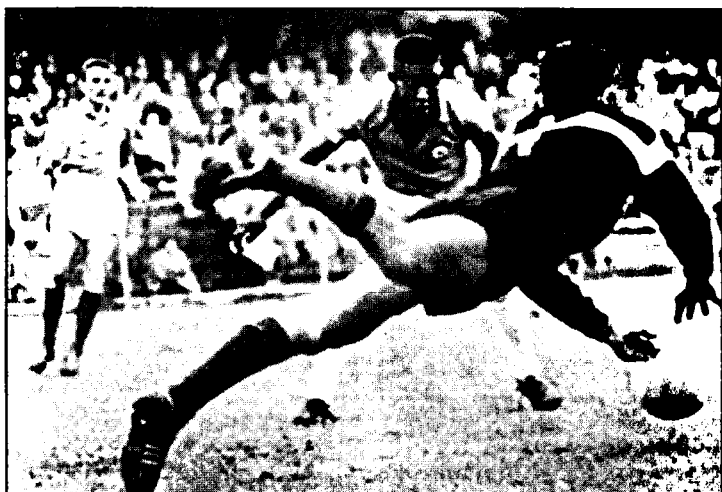
17 ёшли Пеле французлар дарвозабони Аббес билан яккама-якка чиқмоқда.

фоқ терма жамоалари финал турнирига йўлланма олдилар.