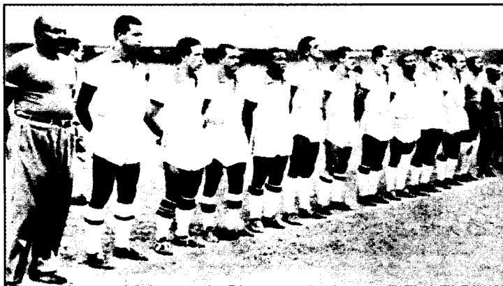
Турнирнинг энг кучли жамоаларидан бири — Бразилия футболчилари ўйинни бошлашга тайёр.

24 июнда янги куриб битказилган “Маракана” стадионида Бразилия—Мексика беллашуви билан чемпионатнинг очилишидан сўнг мамлакатда шу кунгёқ улкан карнавал бошланиб, турнир якунлангунга қадар уч ҳафта давомида мундиалга файз багишлаб турди. Чемпионатнинг энг катта шов-шуви эса Англия терма жамоаси атрофида бўлди. Чили термасини югач, англияликлар АҚШ ва Испания футболчиларига ўйинни бой берган ҳолда гуруҳ баҳсларидаёқ қоқилиб, турнирни тарк этишга мажбур бўлдилар.