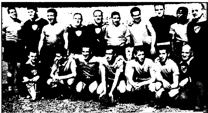
Жаҳон чемпиони — Уругвай терма жамоаси.

Бразилия: Барбоса, Аугусто, Жувенал, Бауер, Данило, Бигоде, Фриака, Зизиньо, Адемир, Жаир, Чико. Голлар: Фриака (47), Скиаффино (66), Чиггиа (79).