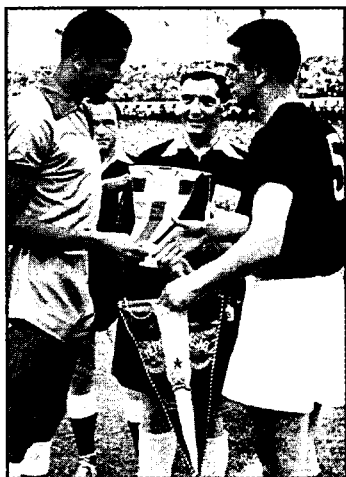
Бразилия ва Венгрия терма жамоаларининг сардорлари Бауэр ва Божиклар чорак финал ўйини олдидан вимпелларни алмашишмоқда.

да қанот ҳужумчиси Ран учинчи маротаба венгрияликлар дарвозасини забт этди. 85-дақиқада Пушкашнинг зарбасидан сўнг венгерлар тўпни тўрға туширадилар. Ўйин ҳаками Линг марказни кўрсатади. Бироқ ёрдамчи ҳакам Гриффитс тўп ўйиндан ташқари ҳолатдан киритилди, деб ҳисоблайди. Беллашув 3:2 ҳисобида тугайди. Аввалги жаҳон чемпионатида бўлганидек, кучли ҳисобланган жамоа яна мағлубиятга учради. Кўпчилик ушбу галабанинг кутилмаганда юз берганини таъкидлади. Лекин фактни рад қилиб бўлмайди. Фолибнинг доимо бир оз омади келади. Ушбу чемпионат ҳозирга қадар энг кўп тўп кири-