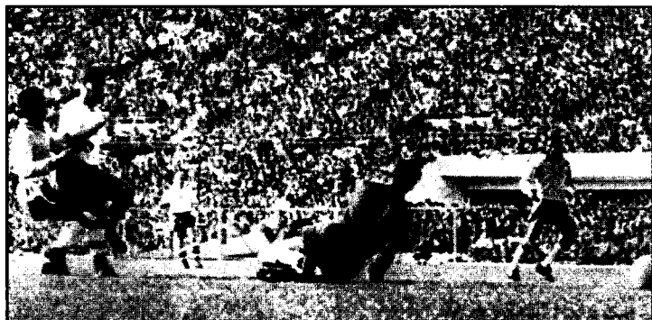
Йозеф Масопуст финал баҳсида ҳисобни очмоқда.

Айниқса, Бразилия ва Англия терма жамоалари ўртасидаги ўтказилган чорак финал учрашуви барчада катта қизиқиш уйғотди. Бразилияликларнинг биринчи босқичдаги унчалик умидбахш бўлмаган ўйини уларнинг ярим финалга чиқишларига ишонч уйғотмаётганди. Пеленинг йўқлигида жамоа етакчиси бўлган Гар-