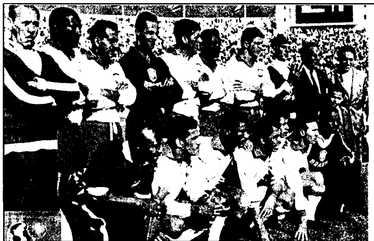
Жаҳон чемпиони — Бразилия терма жамоаси.

Голлар: Масопуст (15), Амарилдо (17), Зито (69), Вава (78).