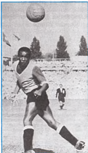
Ҳужумда икки карра Олимпиада ва жаҳон чемпиони уругвайлик Хосе Андраде.

Албатта, ҳақли равишда чемпионатнинг энг кучли жамоаси таркибида 7 нафар Олимпиада чемпиони жамланган Уругвай терма жамоаси эди. Икки карра Олимпиада чемпиони, европаликларни ўз маҳорати билан қойил қолдирган “Олтин оёқли футболчи” лақабли ярим ҳимоячи Хосе Андраде эса уругвайликларнинг энг кучли ўйинчиси эди. Жамоанинг доимий сардори чаққон, тезкор, юқори техникага эга, бош билан яхши ўйновчи, улкан ташкилотчилик салоҳияти учун “Маршал” номини олган марказий ҳимоячи Хосе Насацци эди. 1927 йилда Жанубий Америкада энг сермахсул ҳужумчи бўлган ҳаракатчан Эктор Скароне ҳам жамоанинг етакчи